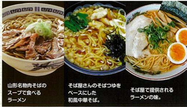
山形名物肉そばの スープで食べる ラーメン